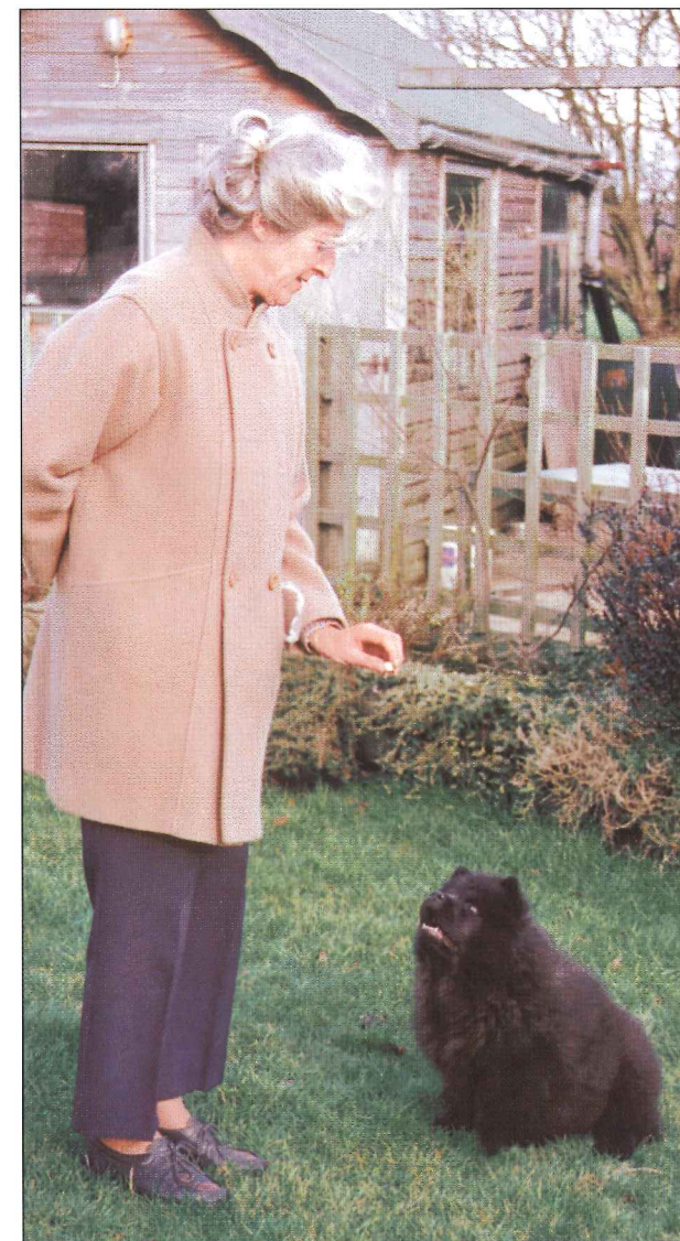
Когда собака усвоила команду “Сидеть”, научить ее навыку “Сидеть – место” нетрудно. Конечно, лакомство для положительного подкрепления никогда не помешает.

Команда “Ко мне” считается одной из важнейших при обуче-