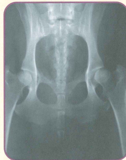
Рентгенограмма собаки с “умеренной” дисплазией тазобедренного сустава.