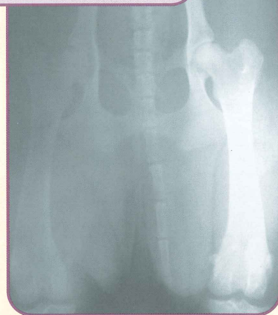
Рентгенограмма “хорошего” тазобедренного сустава.

Дисплазия тазобедренного сустава считается врожденным пороком, но окончательно диагностируется только в двухлетнем возрасте. Некоторые собаководы утверждают, что особая диета помогает исправить этот дефект, если он выявлен еще у щенка, но обычно проблему решают хирургически. Удаляют гребенчатую мышцу, заменяют головку бедренной кости искусственной, реконструируют тазовую часть сустава – все это операции дорогостоящие, но обычно очень успешные. Посоветуйтесь о том, что делать, с ветеринарным врачом.